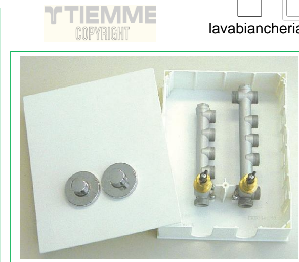
3. Art. 3033