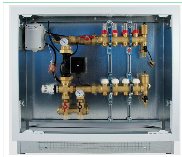
2. Art. 3869